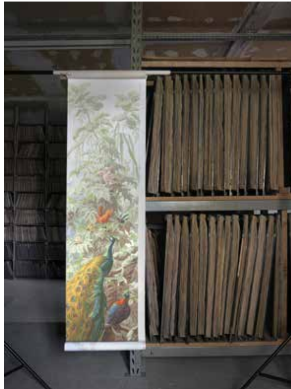
L'enrichissement des collections, Musée de Rixheim, 2016

En posant un regard sur les dispositifs de représentation de l'époque coloniale, le projet évoque la part essentielle du regard de l'autre dans la construction de l'histoire brésilienne. L'enrichissement des collections est une recherche visuelle sur les premières images représentant le Brésil, présentes aujourd'hui dans les institutions culturelles, scientifiques et politiques en Europe. Le dispositif met en question ces images comme instrument de domination, ainsi que le rôle des institutions comme lieux d'autorité – soutenus par un discours « conservateur » qui restreint l'accès à ces documents historiques. Pendant le vernissage de l'exposition L'infini n'a lieu qu'une fois , le dispositif sera présenté par un groupe des médiateurs brésiliens, invités à investir l'oeuvre devant le public. Après des études d'océanographie et de photographie au Brésil, Livia Melzi intègre en 2013 le programme de résidence artistique de l'Ecole Nationale Supérieure de la Photographie, à Arles. Ce parcours pluridisciplinaire marque notamment sa méthodologie artistique qui s'affirme avec le Master Photographie et Art Contemporain à Paris 8. L'artiste convoque la photographie pour nous inviter à examiner les structures du pouvoir présentes dans la production, conservation et diffusion des images, ainsi que les mécanismes de domination colonialistes à l'oeuvre dans l'actualité politique de l'Amérique latine.