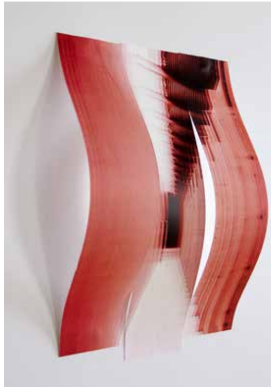
Sans titre, série Spatial Ambigüity, tirage jet d'encre pigmentaire sur papier fine art, dimensions variables, 2018

Arsenio Felipe Reyes nous transporte à travers la visualisation des dimensions supplémentaires du monde. Pour Reyes, nos corps cherchent à établir une liaison physique, mais aussi sensible avec les espaces qu'ils traversent. Reyes se concentre sur des espaces architecturaux et sur leurs possibilités de démultiplication, par l'agencement projectif et progressif de lignes. Ces espaces invitent à être traversés et parfois modifiés par notre regard. Reyes pose la question sur notre capacité à construire, à l'intérieur de ces limites, nos propres espaces de perception sur lesquels se déroulent les événements quotidiens. Il propose des photographies-sculptures. Ces images sont le résultat d'un processus de reconstruction dont il convoque les notions de superposition, pli, interstice et simultanéité de la structure spatiale : espaces qui invitent à être perçus, vécus et ressentis par le spectateur. Après une formation en photographie au Roberto Mata Taller de Fotografía, Reyes intègre le master Photographie et Art Contemporain à l'Université Paris-8. Depuis 2010, son travail a été visible dans plusieurs expositions personnelles et collectives dans son pays, en France et aux États-Unis. En 2011, il obtient le premier prix de photographie de la 6e biennale de Maracaibo au Venezuela.