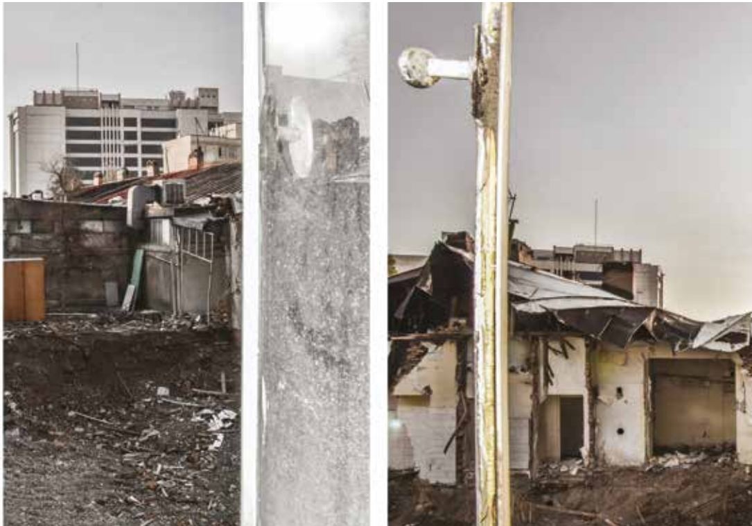
Poesis pour la révolution à venir, Série À nos amis : Téhéran, l'année zéro, installation photographique, tirage dos bleu, 50 cm x 60 cm, 2018