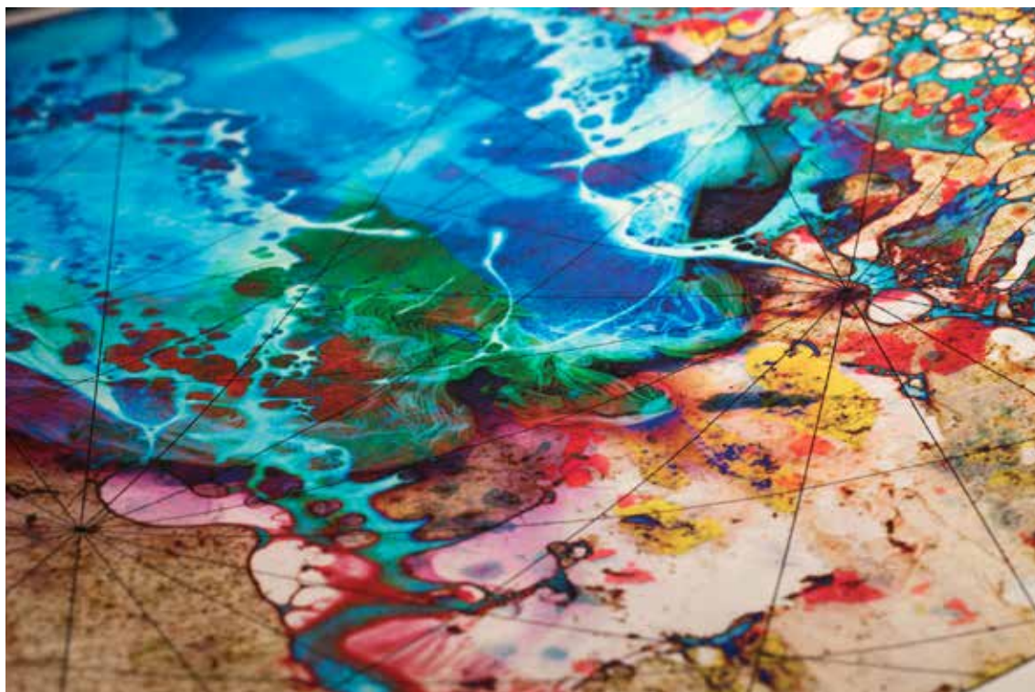
Carte d'Atlantide, série Mémoire d'Atlantide, tirage jet encre sur papier japonais awagami à partir de négatif 6x6 cm immergé dans l'eau, 190 cm x 65 cm

Mémoire d'Atlantide est un projet photographique qui prend forme par l'ensemble d'observations réalisées suite à l'immersion d'un négatif dans l'eau. Le film photographique est la métaphore d'un territoire, d'une idéologie engloutie, celle de l'Atlantide. L'Atlantide est d'abord un mythe - forgé par la plume de Platon au IV e siècle - expliquant une pensée politique qui présente des points en commun avec l'utopie moderne. Ce projet cherche à questionner la forme d'une « Atlantide contemporaine » et la mémoire de ses idéologies utopiques inachevées. L'ensemble des réalités sociales, culturelles, politiques et économiques subit une transformation morphologique : les souvenirs déformés, affirment une nouvelle mémoire qui a résisté au milieu aquatique. Et si l'eau avait une mémoire, ce travail en montre les moyens d'expression liés à la sphère de l'imaginaire, ainsi que la forme d'une idéologie engloutie inscrite sur le support photographique.