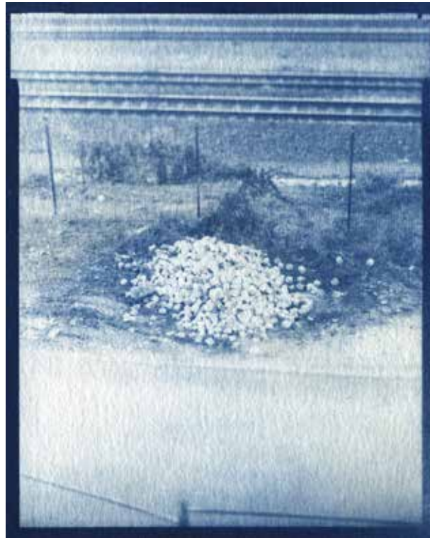
Les Pavés, Série Les choses : non-événement photographique ou Kairos, cyanotype, 2018