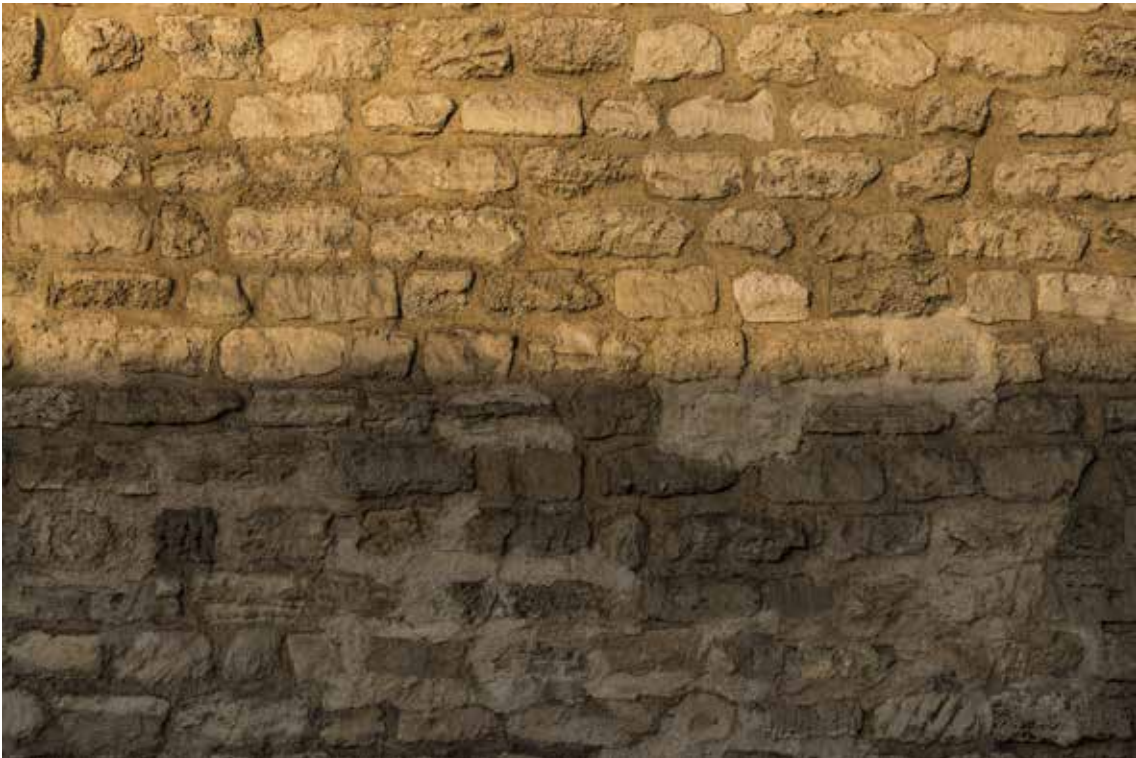
Seuil 1190, série Seuil,

tirage jet d'encre pigmentaire sur papier coton, 140 cm x 210 cm, 2018