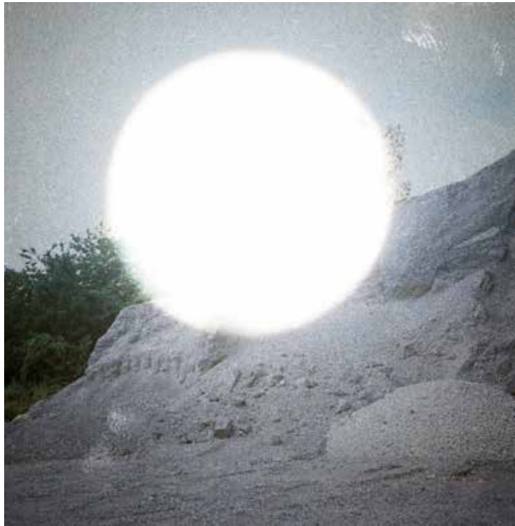
Entroptique #2, série Entroptique , tirage translucents, 70 cm x 70 cm, 2018

Les travaux présentés dans L'infini n'a lieu qu'une fois sont le résultat de plusieurs recherches plastiques menées durant son master en Photographie et Art contemporain à l'Université Paris 8, incluant les projets Entroptique et Zones Blanches . Entroptique est un travail sur l'entropie du paysage au sens où Robert Smithson la définissait, à savoir une dégradation croissante et irréversible.