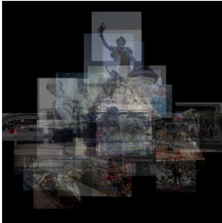
Statue de la République: 18 janvier 2015 - 23 janvier 2015, série Momumentum in progres, projection fixe couleur, dimensions variables, 2015